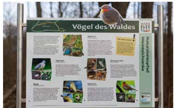
Eine der elf neuen Tafeln des Natursinnespfades.

Mit dem Zeigen der Schautafeln ist das Angebot noch nicht abgeschlossen. „Sie sind erst der Anfang“, sagt die Projektverantwortliche Anja Meitzner. „Vor allem interaktive Elemente sollen noch hinzugefügt werden.“ Sie ergänzen den Natursinnespfad und stellen auf spielerische Art und Weise die Biodiversität der Weiteichsenke heraus. Stück für Stück werden Einführungstafeln, Flyer mit Rätseln und Spielspaß sowie weitere spannende Elemente, wie zum Beispiel ein Insektenhotel, ergänzt, sodass der Natursinnespfad phasenweise weiter Gestalt annimmt und von Zeit zu Zeit