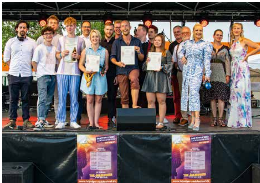
Mit dabei bei „Leipziger rockt“ sind die Finalisten des „Sibylla Augusta Preis“.

Am 1. Juli geht das Festival am Bösdorfer Ring in die dritte Runde