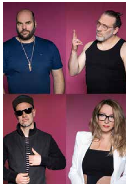
Die Guano Apes sind der Headliner 2023.