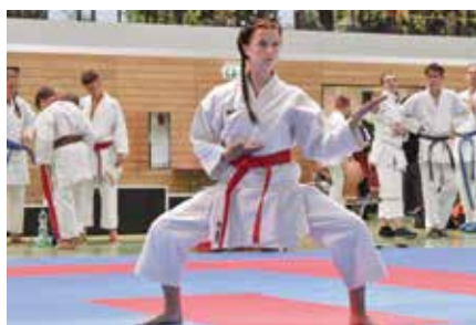
Verein Kimura Shukokai Karate M'berg e.V.