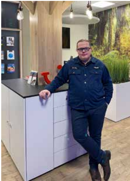
Angelo Kelly zu Besuch in Markkleeberg

„Mixtape“-Tour gastiert im „Haus Leipzig“